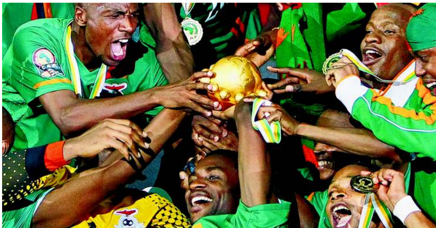
Mit besonderer Energie zum größten Erfolg: Sambias Spieler feiern den Finalsieg gegen die Elfenbeinküste.

Bwalya selbst gab keine Interviews nach dem Finale. Den größten Triumph des sambischen Fußballs ausgerechnet am Ort des größten Unglücks erreicht zu haben, verarbeitet er lieber still. Noch drei Tage zuvor hatte er mit den Spielern Blumen am Strand von Libreville niedergelegt – nur 500 Meter von der Stelle entfernt, an der die Maschine 1993 auf dem Weg zu einem